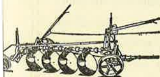
ado de Discos para trac- de construção reforçada.

O TracTractor International não é um tractor apenas para planicies; trabalha com toda a efficiencia tambem nas encostas e vence irregularidades topograficas com facilidade.