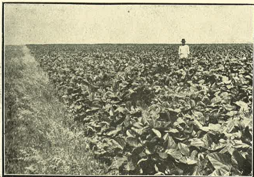
Photogr. 1 — Campo com feijão de porco, Fazenda Sta. Eliza do Instituto Agronomi'co de Campinas.