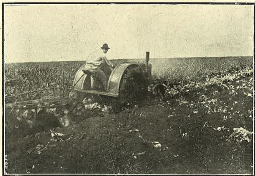
Photogr. 2 — Tractor puxando um arado de 3 discos, enterrando o feijão de Porco na Fazenda Sta. Elisa do Instituto Agronomico de Campinas.